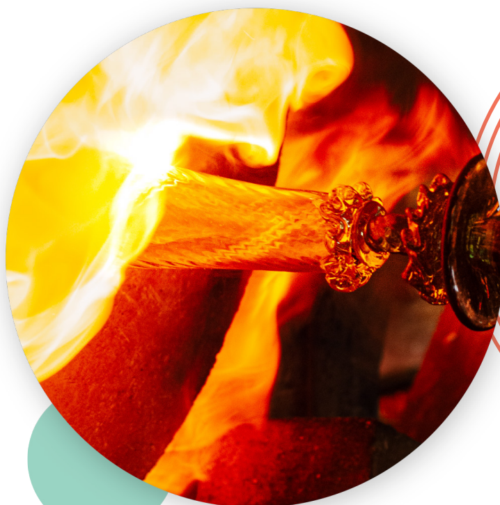
Procés de fabricació de la copa Soraya. Gordiola